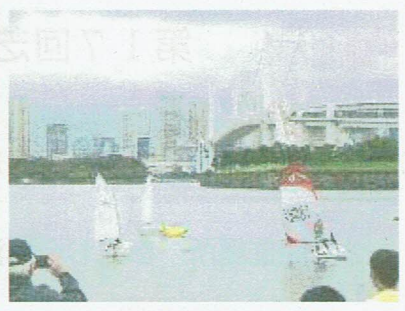
お台場学園セーリング部