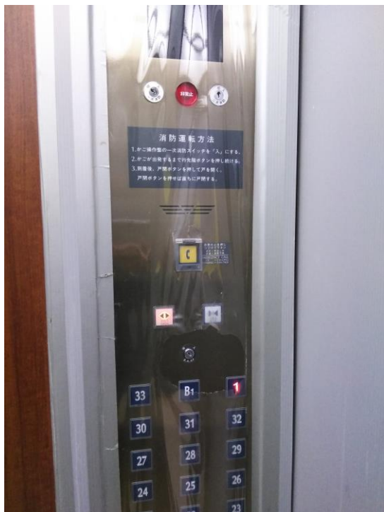
ザ・タワーズ台場 エレベータ内のカバー