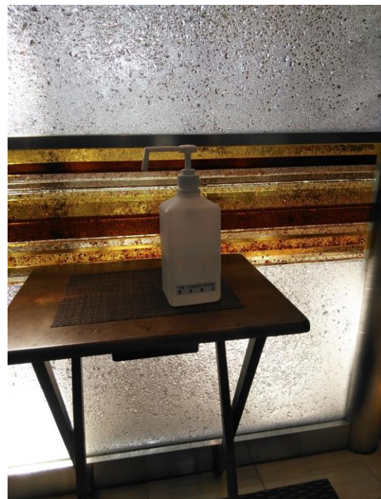
ザ・タワーズ台場 1階入り口の消毒液